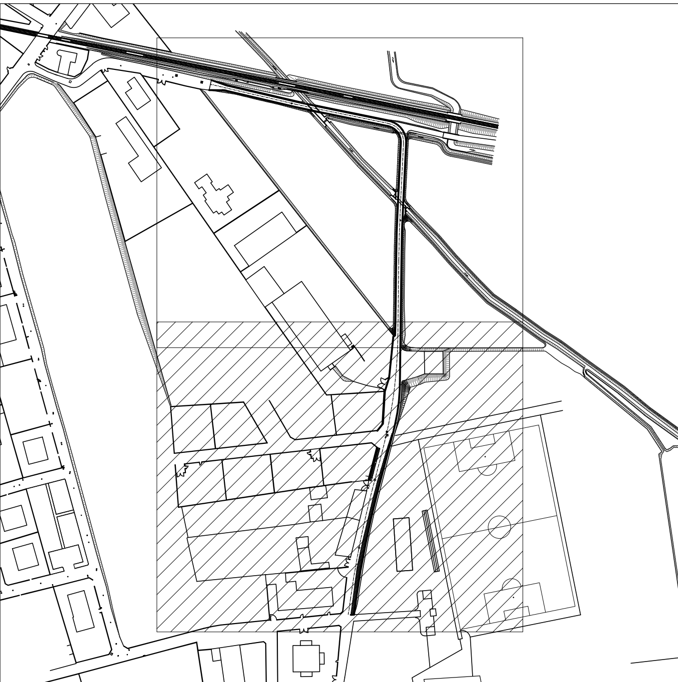
QUADRO DI UNIONE - Scala 1:2.000